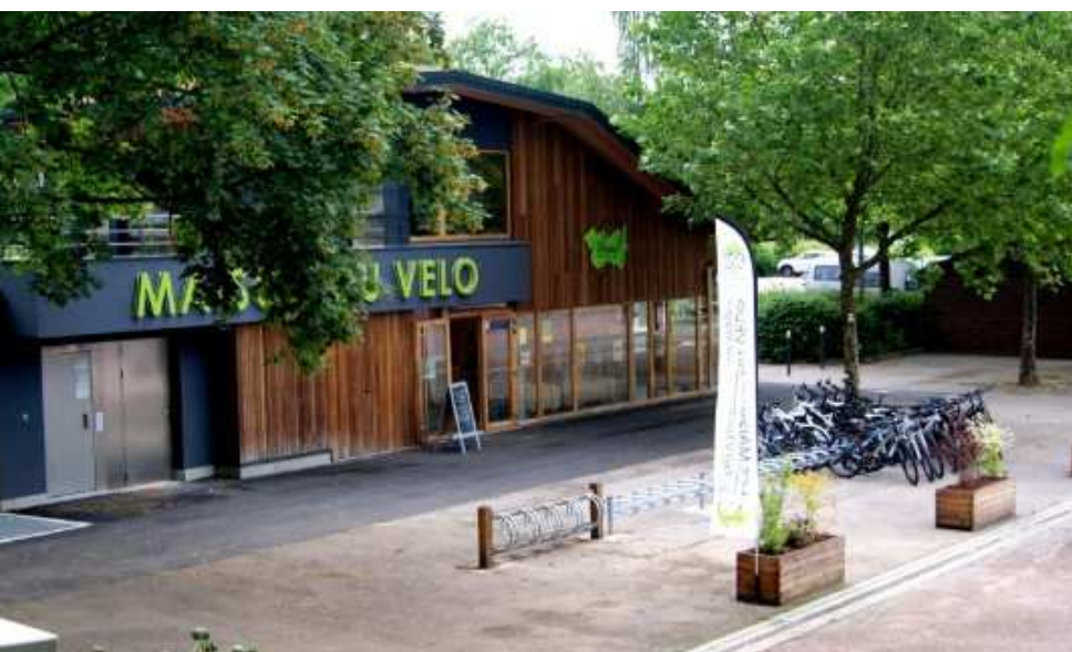
Maison du Vélo Stand n°1

de 2 à 98 kilomètres. Le département des Vosges, c'est aussi, 73 kilomètres de véloroute sans difficulté particulière qui le traversent en suivant le canal des Vosges.